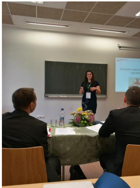
Előadás a XXII. MÉTE OTDK-n