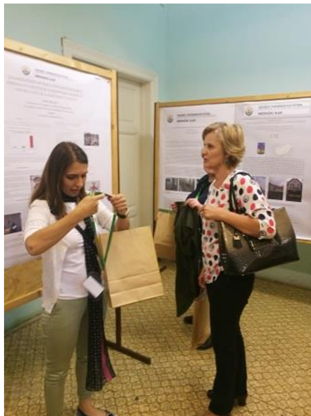
Poszterek a 16th Wellmann Internationale Scientific Conference-n