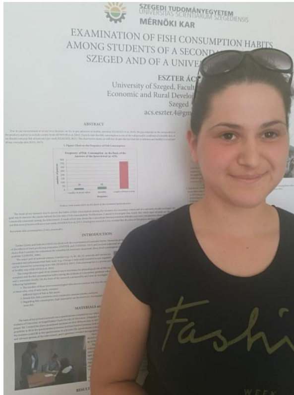
Poszterek a 16th Wellmann Internationale Scientific Conference-n