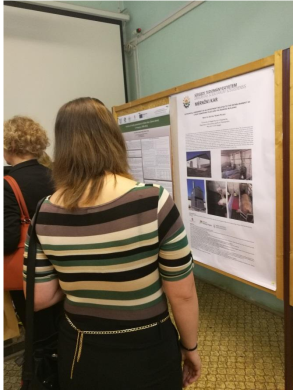
Poszterek a 16th Wellmann Internationale Scientific Conference-n