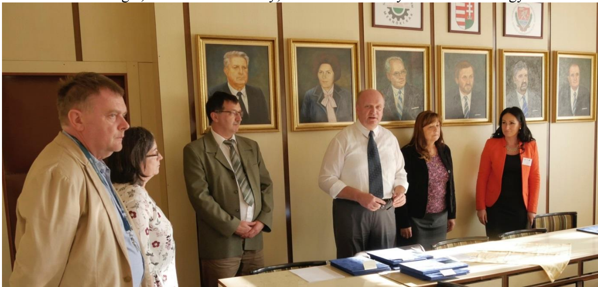
A szakmai zsűri eligazítása

A Szegedi Tudományegyetem Mérnöki Karán 2017. november 7-én tartottuk meg az őszi Tudományos Diákköri Konferenciát. Hat szekcióban közel 50 hallgató mérte össze a tudását élelmiszertechnológia, élelmiszertudomány, műszaki tudomány és ökonómia tárgykörben.