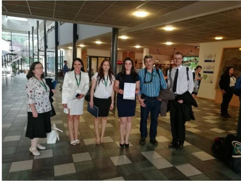
Fénykép a XXII. MÉTE OTDK-ról