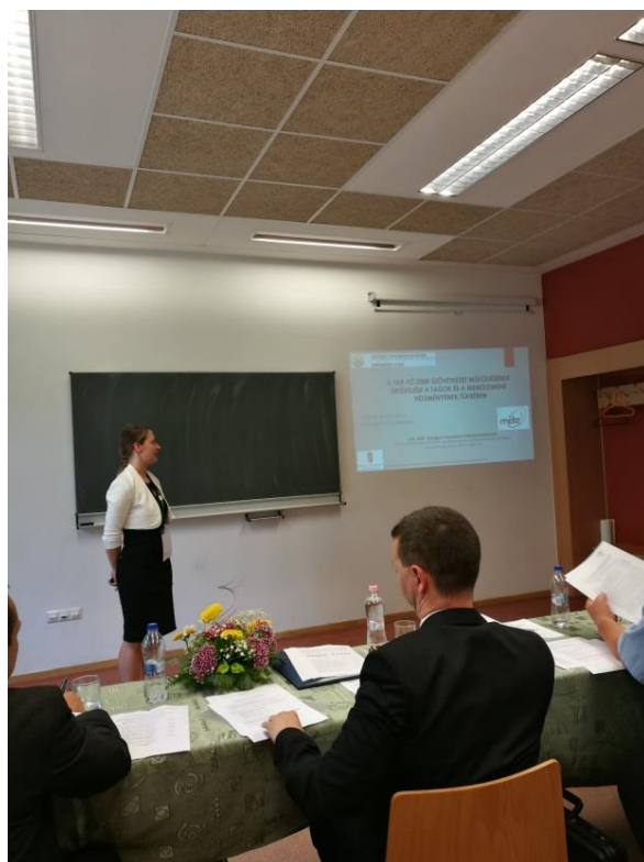
Előadás a XXII. MÉTE OTDK-n