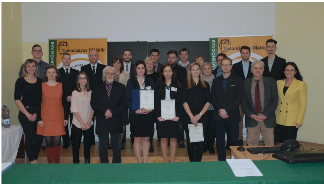
Csoportkép a díjazottakkal, a zsűrivel és a felkészítő tanárokkal az SZTE MK tavaszi Tudományos Diákköri Konferenciáján